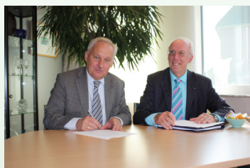
Ondertekening sponsorcontract Rabobanken en ZHVKK

staat gesteld haar activiteiten op het gebied van het verbeteren van de leefbaarheid op het platteland te continueren. De ZHVKK is dan ook uitermate erkentelijk voor de financiële steun van deze Rabobank en blij met de goede samenwerking tussen beide organisaties.