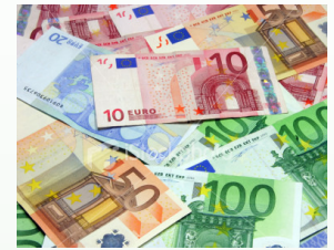
De successiewet is veranderd

Voor meer informatie kunt u kijken op de website http://www.anbi.nl .