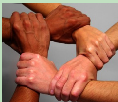
Bij Paled staat samenwerking centraal

Een mooie uitspraak van een van de werkgroepleden tijdens de presentatie van het concept dorpsplan Langeraar/Papenveen op 18 januari jl. was: "We maken geen wensenlijst voor de gemeente, we moeten vooral ook zelf aan de slag gaan. Niet alles kan en er moeten keuzes gemaakt worden. Wij kunnen meehelpen de juiste keuzes voor ons dorp te maken." Wij hopen dat ondanks de druk op de financiën de gemeente Nieuwkoop ook met en voor de inwoners