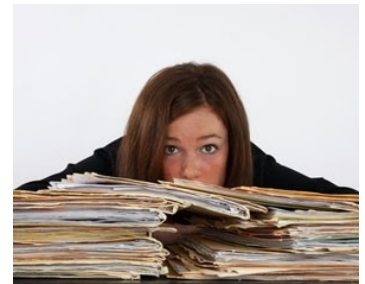
Van dorpsplan naar uitvoering valt soms niet mee

"ZELF WOONZAAM IN LINSCHOTEN IS HIJ ZEER BEGAAN MET DE LEEFBAARHEID OP HET PLATTELAND"