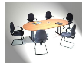
De ZHVKK heeft nu zes bestuursleden en een adviseur