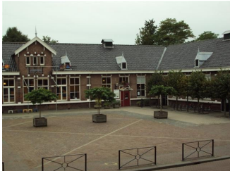
Het Diekhuus in Middelharnis

Op woensdag 11 mei heeft in 'het Diekhuus' in Middelharnis de voorjaarsbijeenkomst van de ZHVKK plaatsgevonden. Op deze bijeenkomst met het thema 'Vernieuwend Ondernemerschap' is aandacht besteedt aan diverse vormen van ondernemen.